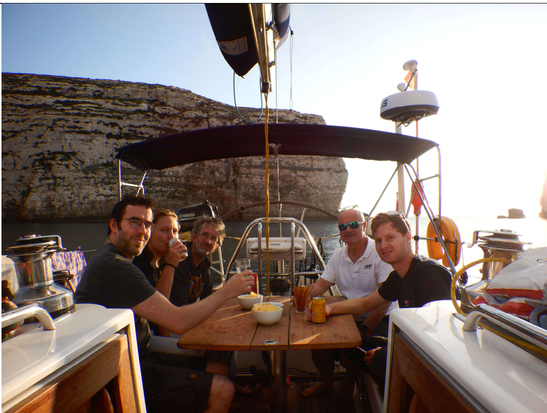
Apéro : c'est aussi le respect de certaines traditions pour l'équipage motivé