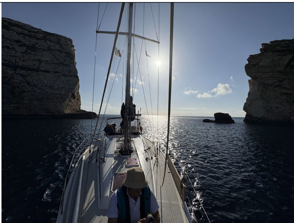
Qala tad-Dwejra est située sur la côte sud de Gozo ; c'est une brèche dans le cirque du cratère qui permet d'y accéder depuis la mer.