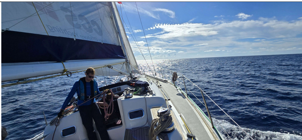
Vent de travers : c'est un vrai plaisir de glisser !