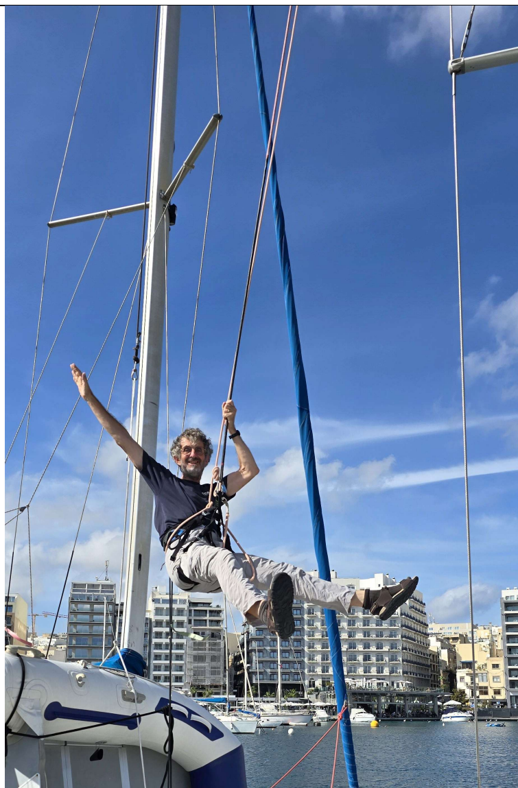
L'inspection des haubans...et n'oublions pas que nous sommes sur le Flying !