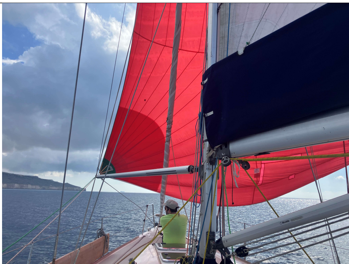
Notre premier test du spi : il n'exclut pas la contemplation...