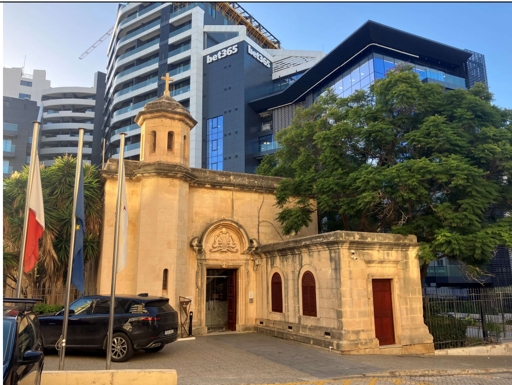
Comment le dites-le vous ? - Contraste ? – Anachronisme ? – Intégration ?