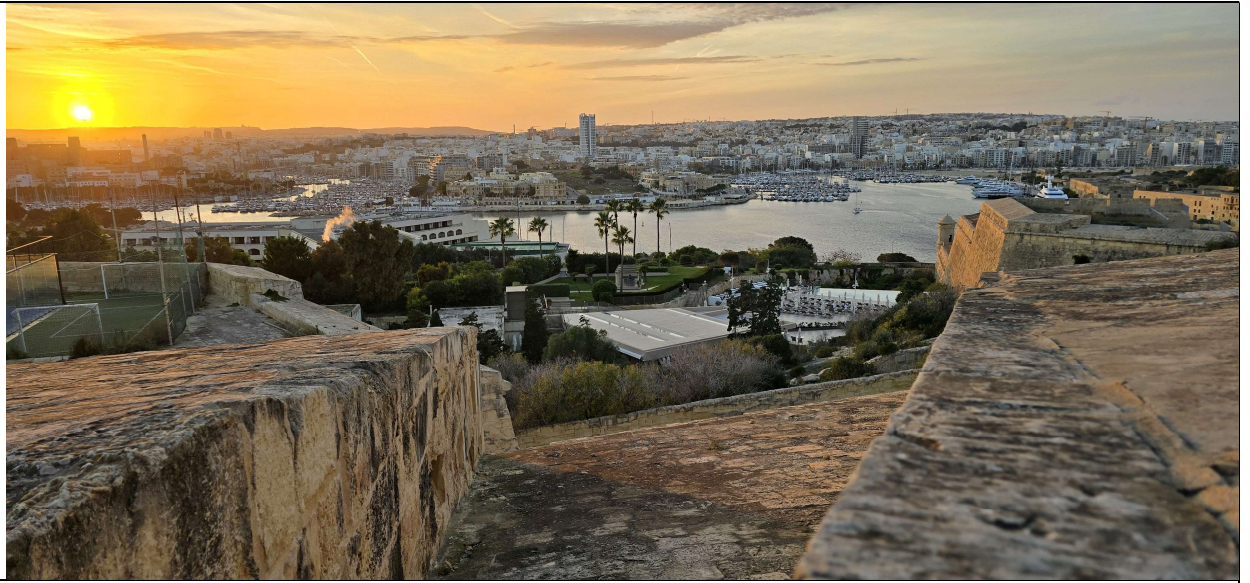
Coucher de soleil depuis les fortifications de La Valletta...

Et Malte est aussi un lieu chargé de culture et d'histoire